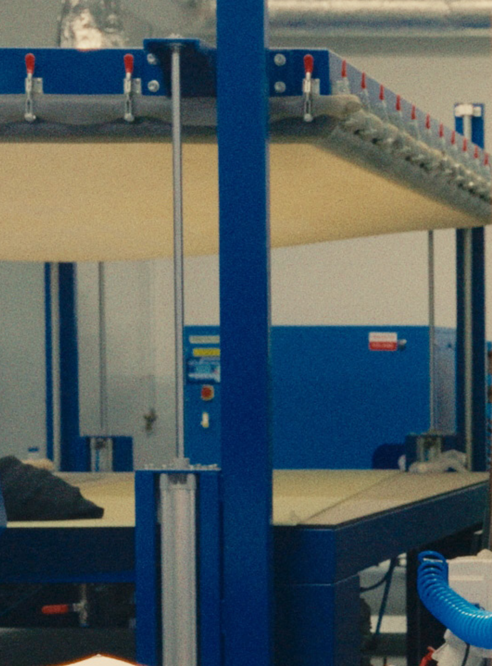
Plaster cast being removed from the negative mold printed on the 3D printer Paulina Mucha