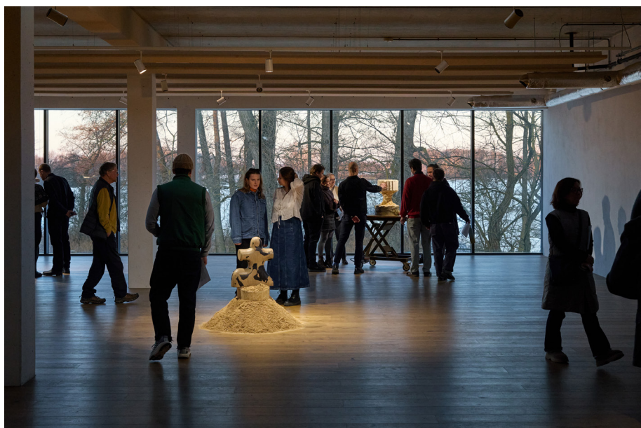
Exhibition view Craftology Final Show