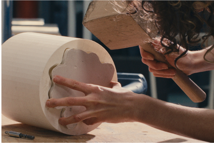
Plaster cast from the negative mold printed on the 3D printer Paulina Mucha