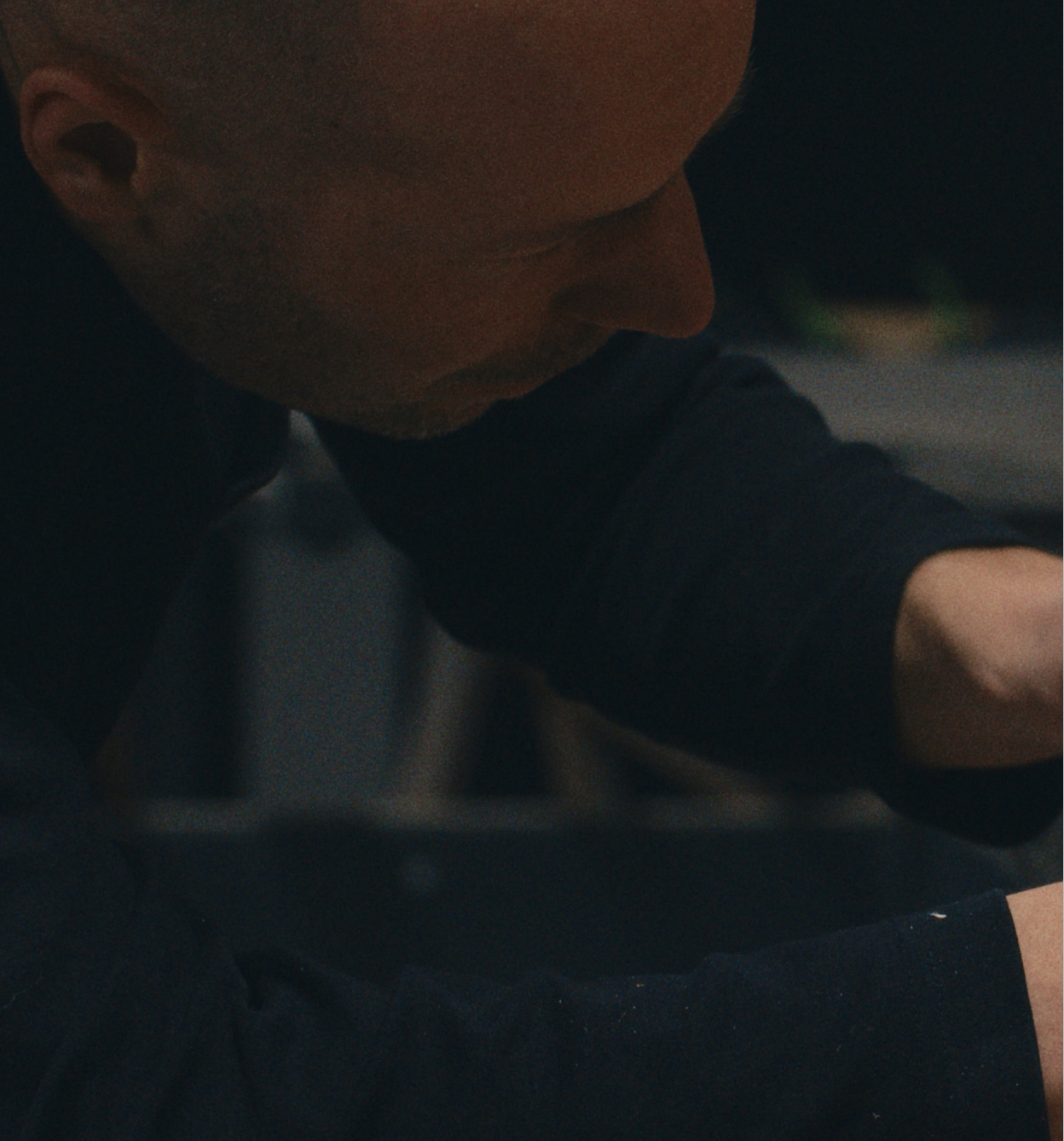
Detailed carving of the form initially milled by the CNC Marcin Ebert