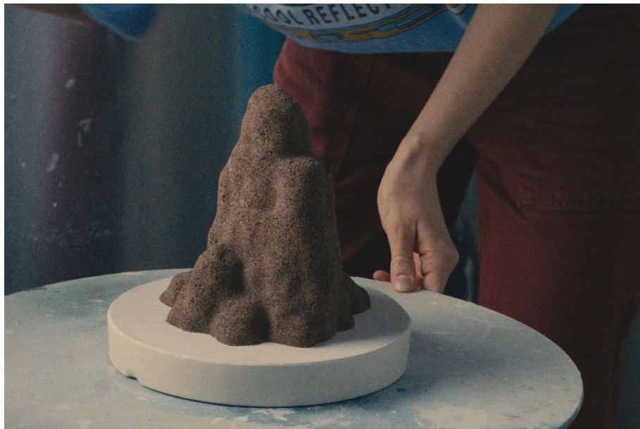
Sand cast iteration as a base for the stalagmites formation Paulina Mucha