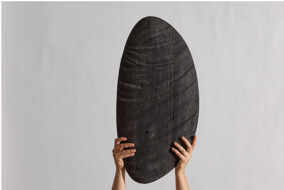
Sculpture by Paweł Jasiewicz Oak (sandblasted and oxidized)