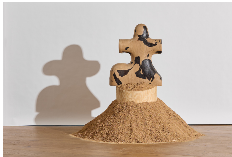
Sculpture by Janek Wilczak Oak