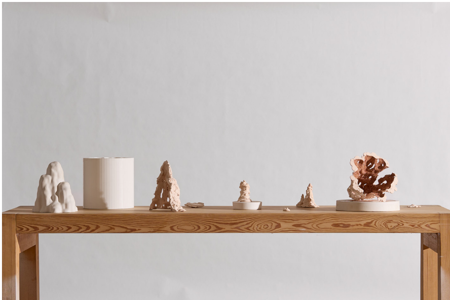
Sculptures by Paulina Mucha Plaster, casting material, sand