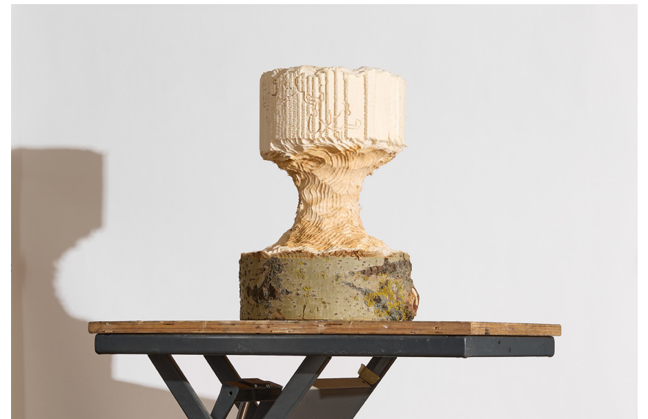
Object by Marcin Ebert Alder