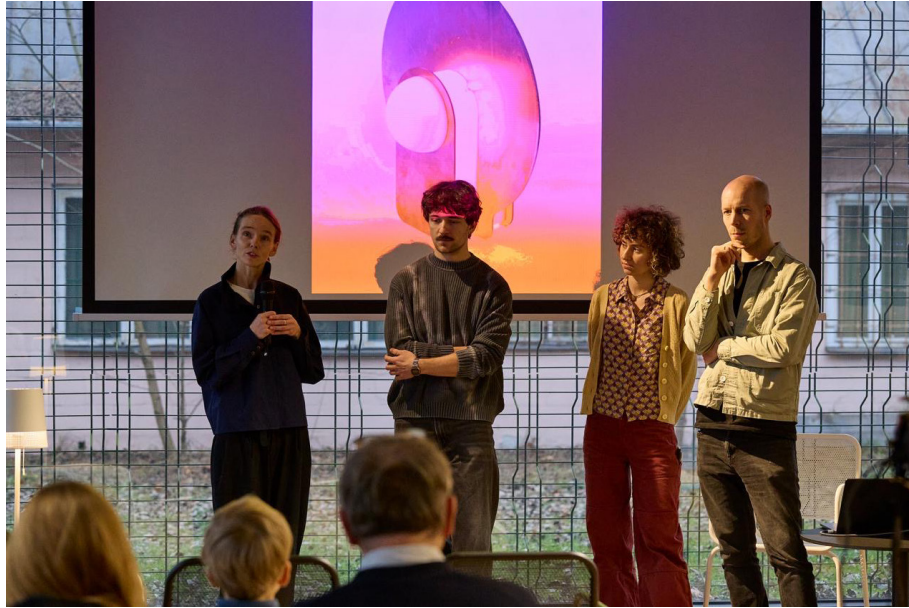
Introduction of the residents Craftology Opening Event