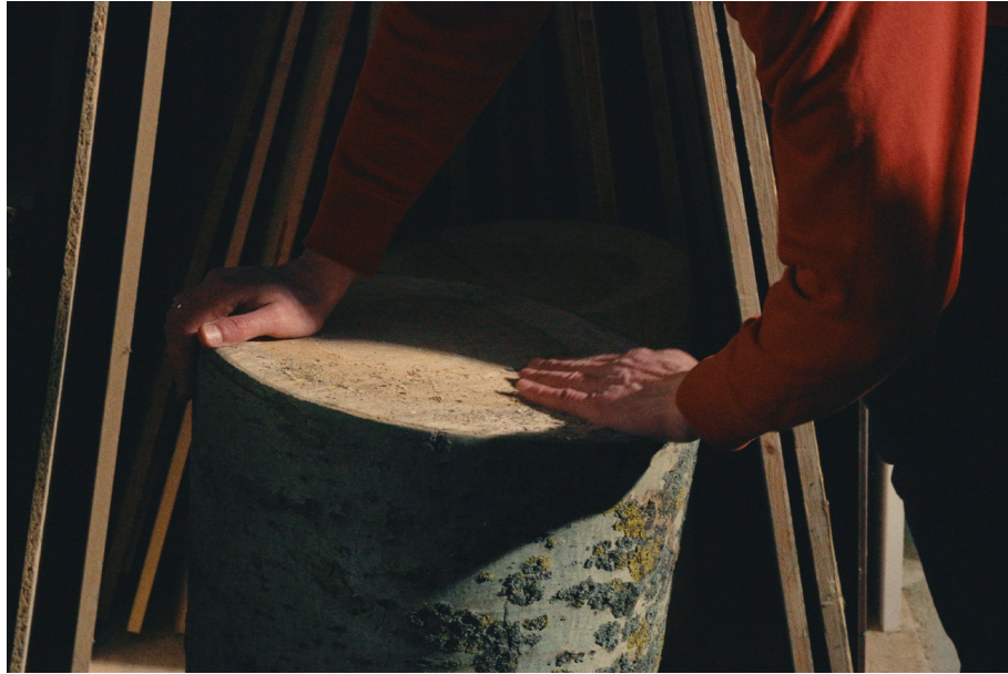
Alder stamp, material processing Marcin Ebert