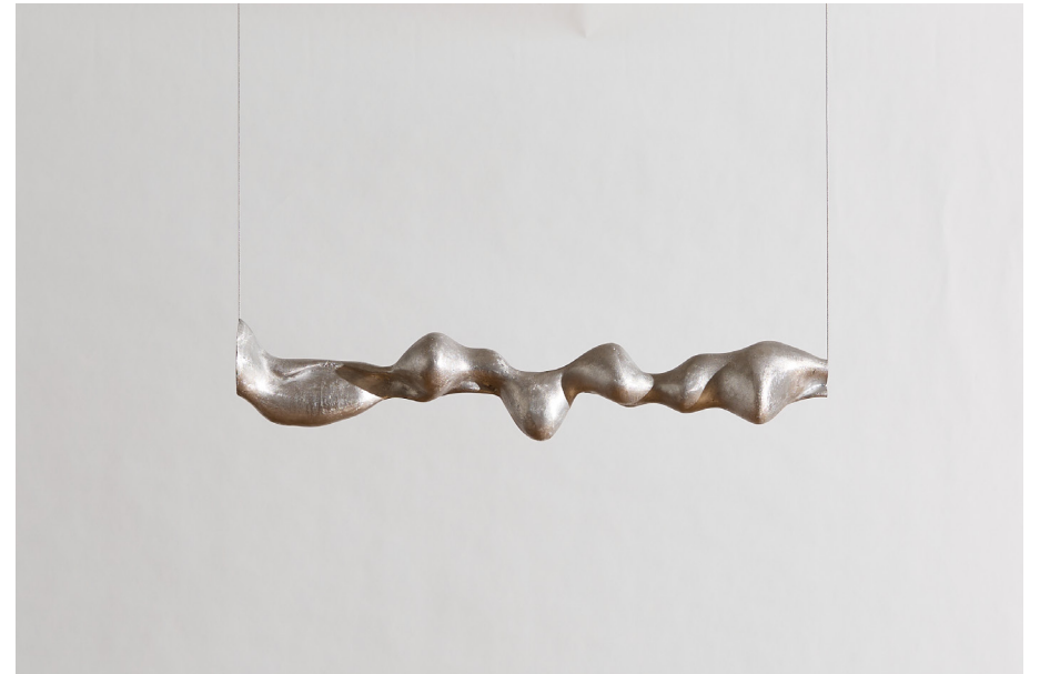
Sculpture by Agnieszka Wach Aluminium